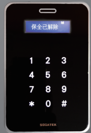
顯示型感應副控讀卡機 IS-A203M